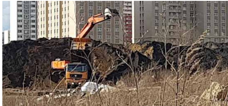
Современное состояние территории. Навалы мусора и непонятное производство

Напомню, что это территория главного вуза страны. Непонятно,