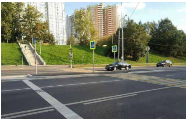
Депутатские обращения. Пешеходный переход на Мичуринском, д. 58

Отчет публикуется в сокращенном виде, полную версию читайте на сайте www.ramenki.su