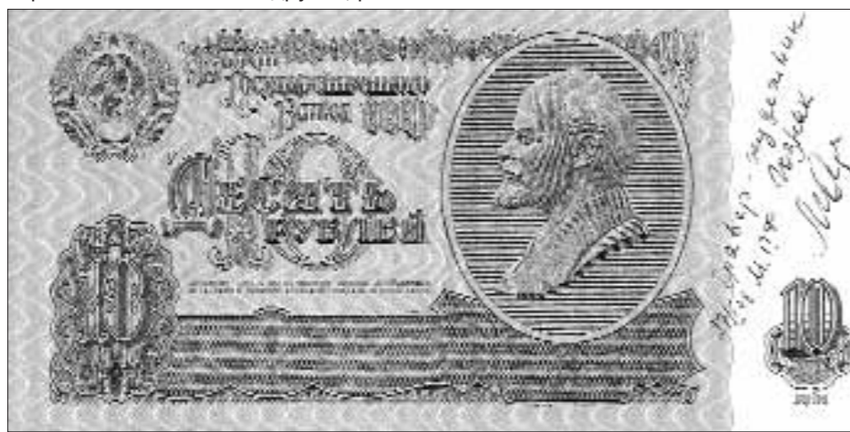
Портрет В.И. Ленина с гравюры Лидии Майоровой