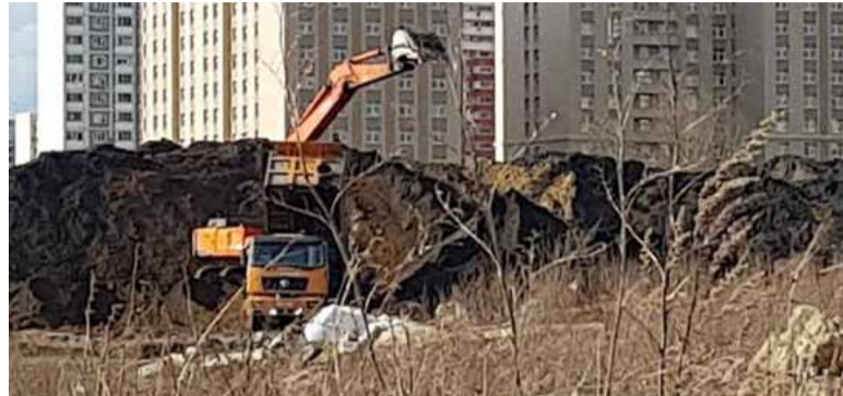
Современное состояние территории. Навалы мусора и непонятное производство

Напомню, что это территория главного вуза страны. Непонятно,