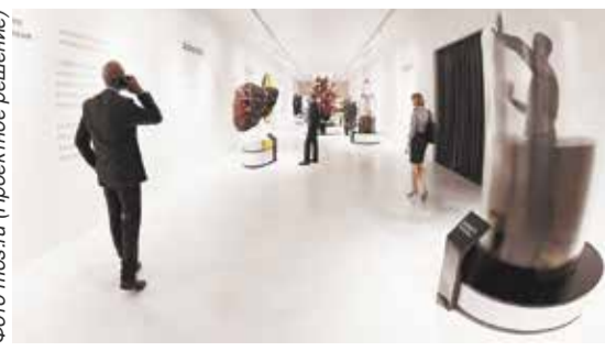
(Проектное решение)

Подробная программа Московского урбанистического форума и карта выставочного пространства доступны на официальном сайте.