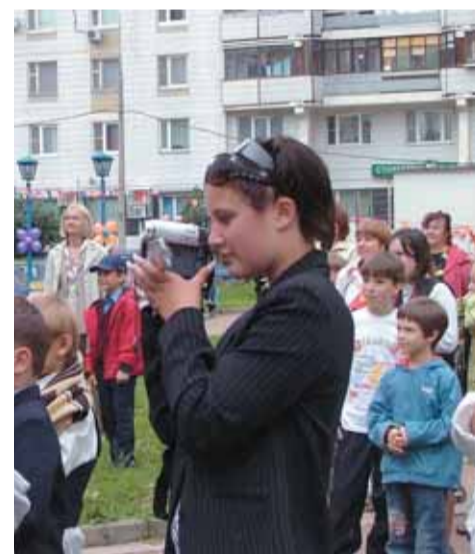
На задании газеты «РГМ»