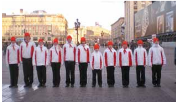
Подготовка к параду 7 ноября

• Начался репетиционный, подготовительный период к параду 7 ноября на Красной площади. Для РПО «Раменки» это уже пятый, юбилейный парад. Всего в параде примут участие 3000 участников детских общественных организаций и объединений. Весь октябрь пионеры будут репетировать парад на плацу Комендантского полка Москвы, на Ходынском поле, а