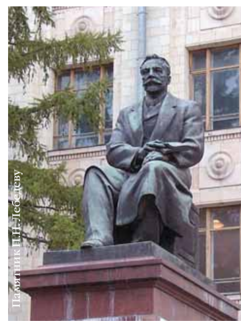
Памятник П.Н. Лебедеву

Параллельно улице Менделеева проходит улица Лебедева. Она названа в честь великого русского физика Петра Николаевича Лебедева (1866–1912) . Памятник ему (скульптор А.К. Глебов, 1953 г.) стоит возле главного входа в здание физического факультета МГУ. Это выдающийся ученый, основатель первой в России научной школы физиков. Он впервые получил и исследовал миллиметровые электромагнитные волны (1895), открыл и изучил давление света на твердые тела (1899) и газы (1907), на практике подтвердив электромагнитную теорию света, занимался также проблемами ультразвука. Интересно, что некоторые приборы ученого были настолько малы, что их можно было носить в кармане. Идеи Лебедева нашли свое развитие в трудах его многочисленных учеников. Он дважды получал приглашения из Института Нобеля в Стокгольме, где ему предлагали должность директора лаборатории и материальные средства. Однако Петр Николаевич Лебедев остался на Родине, со своими учениками. Стоял вопрос