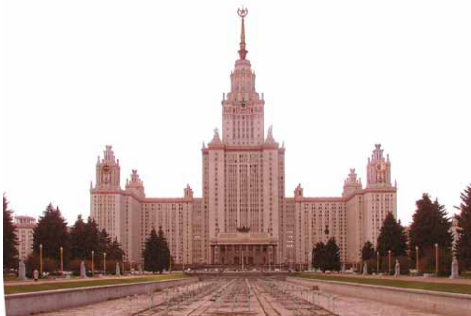
Аллея учёных возле здания МГУ им. М.В. Ломоносова (бюсты учёных — слева и справа от фонтанов)