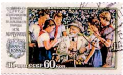
Почтовая марка к 100-летию И.В. Мичурина

номере изображен памятник Ивану Владимировичу Мичурину (1855–1935) , выдающемуся российскому