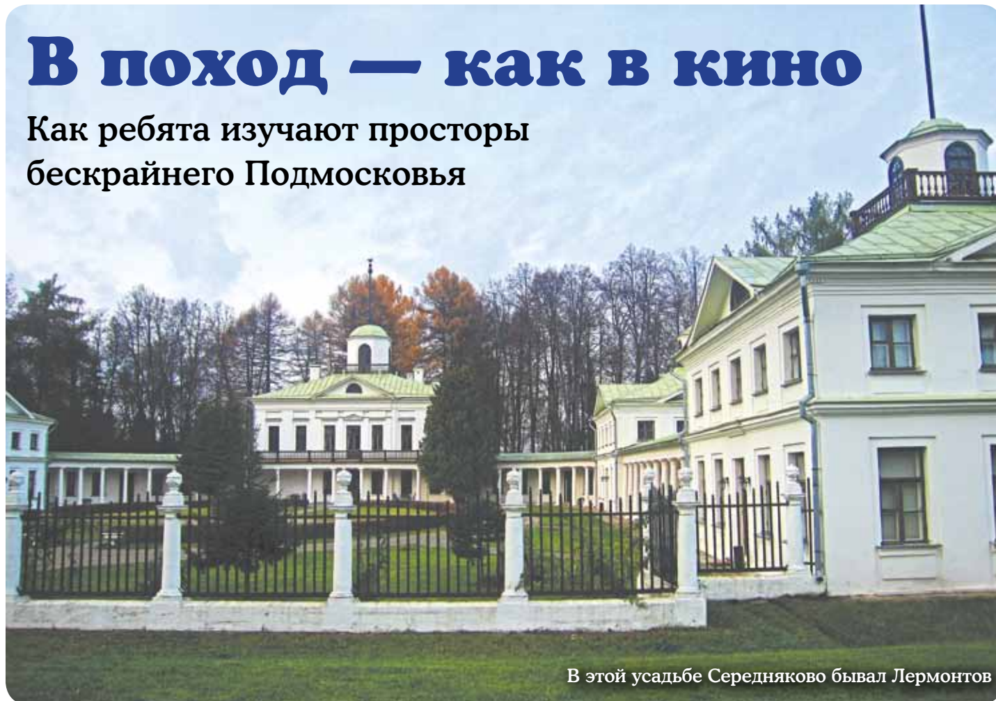
В этой усадьбе Середняково бывал Лермонтов

Как ребята изучают просторы бескрайнего Подмоскovie