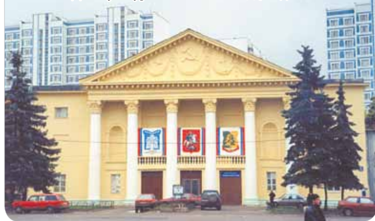
Раменки. Дом культуры «Высотник». 1997 год

ния МГУ, рядом с деревней Раменки, утонувшей в садах, был построен городок строителей Университета. Здесь наскоро соорудили двухэтажные деревянные дома, столовую, танцплощадку и Дом культуры, получивший название «Высотник». В 1958 году Раменки полностью вошли в состав Москвы и в 1960 г. начали быстро застраиваться пятиэтажками. Сегодня от Раменок 50-х остался только ДК «Высотник» — единственный свидетель этого периода истории. Поселок Раменки сожгли в 1979 году перед Олимпиадой, дабы не позориться деревянными домами перед иностранцами. Но