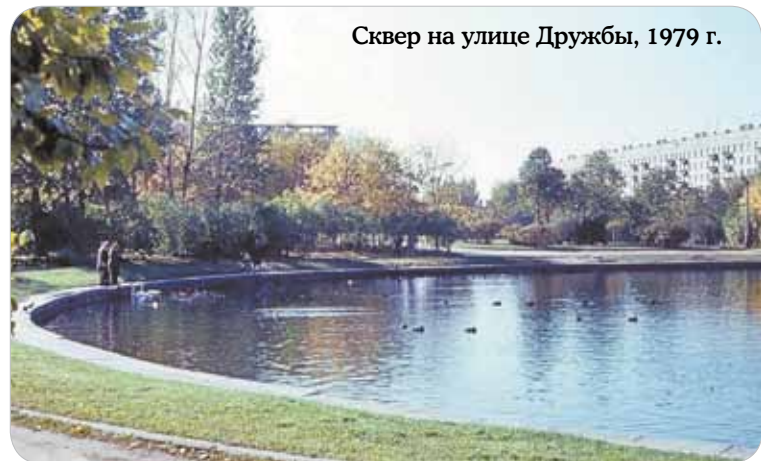
Сквер на улице Дружбы, 1979 г.

Досуговый центр «Ровесник» приглашает жителей к участию в конкурсе «История моей малой родины», посвященном 625-летию Раменок. Пусть воспоминания, старые фотографии, другие документальные находки станут частью летописи, которую мы с вами напишем сообща, чтобы сохранить для будущих поколений. Если у вас есть желание принять участие в конкурсе — звоните в «Ровесник» по тел.: 8-495-932-44-00.