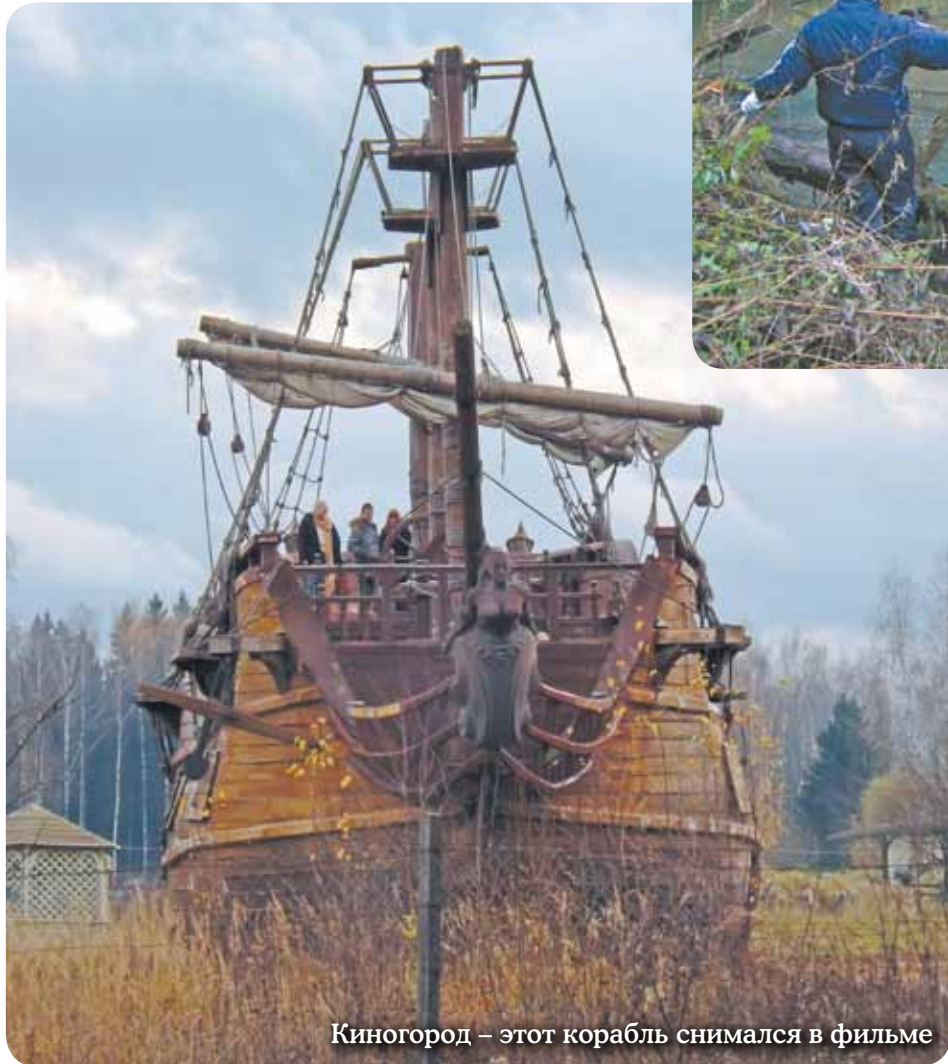
Киногород — этот корабль снимался в фильме