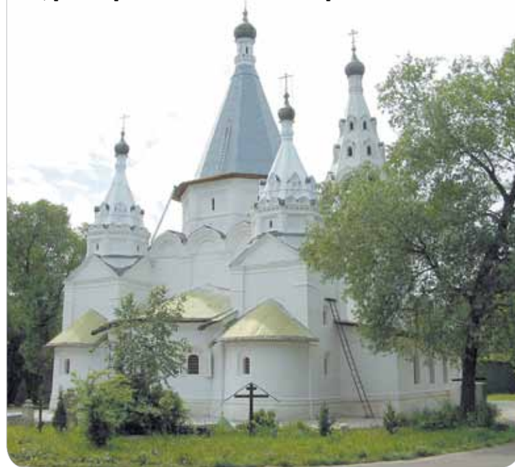
Церковь Троицы Живоначальной в Троицком-Голенищеве

Досуговый центр «Ровесник» приглашает жителей к участию в конкурсе «История моей малой родины», посвященном 625-летию Раменок. Пусть воспоминания, старые фотографии, другие документальные находки станут частью летописи, которую мы с вами напишем сообща, чтобы сохранить для будущих поколений. Если у вас есть желание принять участие в конкурсе — звоните в «Ровесник» по тел.: 8-495-932-44-00.